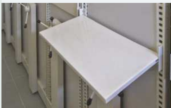
Mese frontale rabatabile