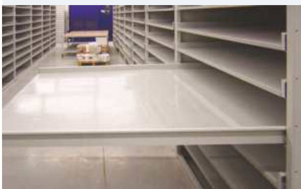
Sertare pentru planșe