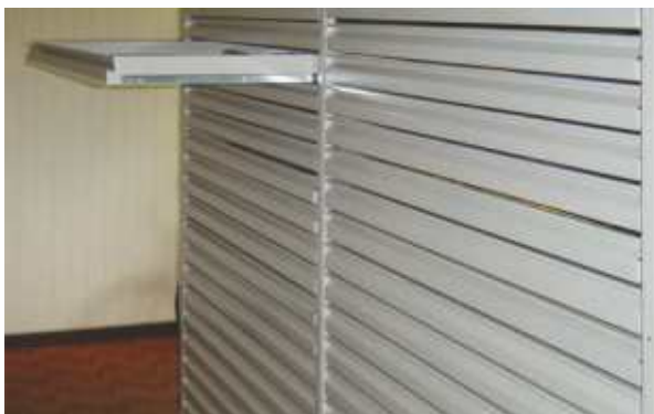
Sertare de depozitare