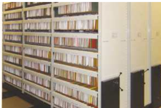
Sisteme pentru stocarea articolelor suspendate și a dosarelor pentru fișiere